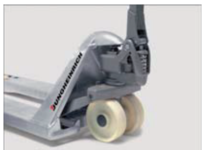
Giunti e snodi autoingrassati esenti da manutenzione

Durante la presa trasversale una marcatura impressa sulla forca indica l'esatto e sicuro posizionamento del carico.