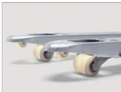
Punta delle forche arrotondate per un facile inforcamento