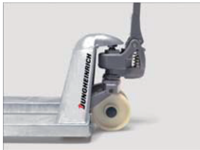
Gruppo idraulico esente da manutenzione