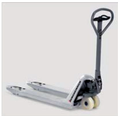
AM G20 – protezione alla corrosione grazie alla zincatura

Il sistema idraulico, ulteriormente perfezionato, richiede una forza limitata per il sollevamento. Le ruote con speciali boccole riducono la forza di trazione necessaria.